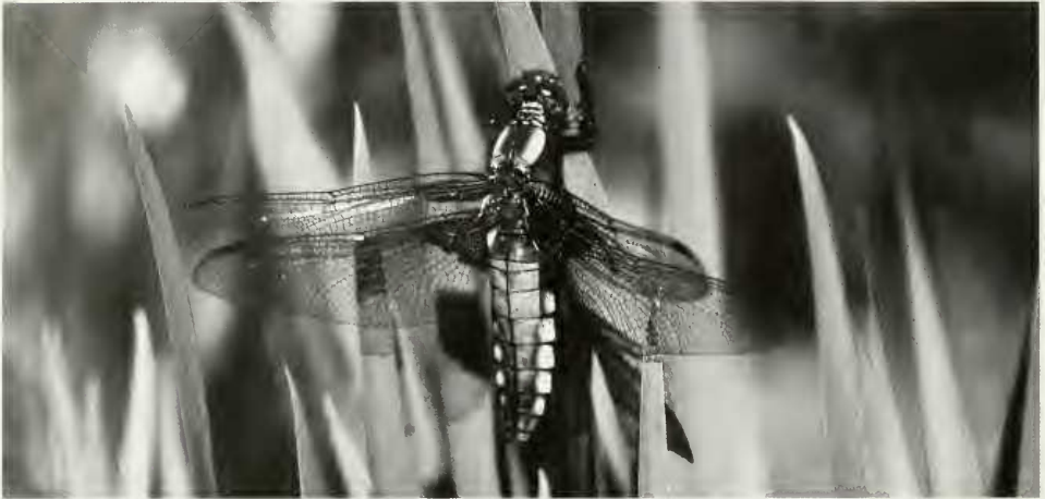
Weibchen des Plattbauchs ( Libellula depressa L.) – Foto: Verfasser.

Nach der Florfliege und dem Rosenkäfer setzt nun diese im Jahr meist als erste auftretende Großlibelle die Reihe herausgehobener Arten fort. Wie der Name sagt fällt sie durch den flachen Hinterleib und zusätzlich durch die dunklen Basisflecken auf den Flügeln auf, wobei das Männchen mit blauem deutlich vom Weibchen mit gelb-braunem Hinterleib unterschieden werden kann. Häufig findet man den Plattbauch an Kleingewässern, Tümpeln vorzugsweise in Kies- und Sandgruben sowie Tümpeln aller Art. Hier werden die Pionierstadien mit geringer Vegetation bevorzugt. Die Männchen kehren nach kurzen Patrouilleflügen immer wieder zu markanten Sitzwarten zurück, die Weibchen vagabundieren, teilweise weit vom Gewässer entfernt, umher und besuchen dieses nur zur Paarung und Eiablage. Letzere erfolgt vorzugsweise auf oberflächlich flutenden Algenwatten. Die aquatischen Larven leben zunächst in Flachwasserbereichen mit lockerer Vegetation, die sie im Laufe der Entwicklung verlassen, um sich im sändig-lehmigen Rohbodenschlamm einzugraben oder um sich an der Oberfläche durch helle Schlammartikel zu tarnen, die in der dichten Behaarung gehalten werden.